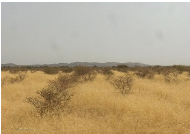
Illustrazione 3: Foraggio in quantità per l'allevamento, principale attività di sussistenza

“La lotta alla povertà comincia dalla lotta alla povertà del suolo” Motto dell'Associazione Deserto Verde, adottato da una frase dell'animatore di Reach Italia Amadou Boureima.