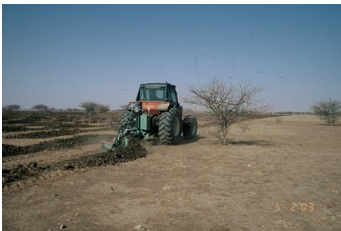
Illustrazione 1: Scavo meccanico dei micro-bacini con l'aratro del fieno durante la stagione secca (gennaio-febbraio)