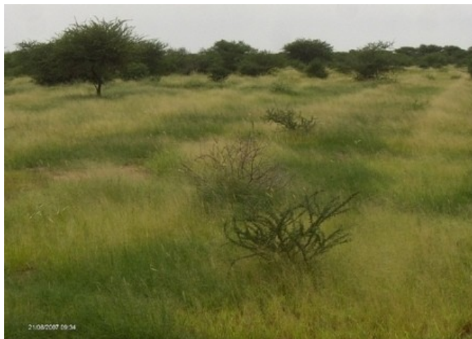
Illustrazione 2: La copertura vegetale dopo alcuni mesi dal termine della stagione delle piogge.